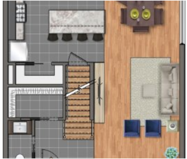
Vente sur plan