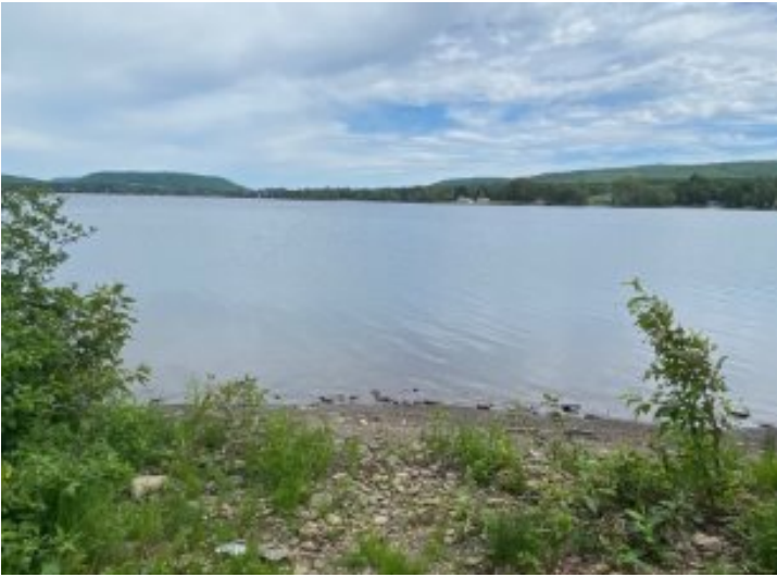
Bord de l'eau