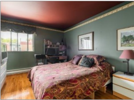
Chambre à coucher principale

MONTRÉAL (LE PLATEAU-MONT-ROYAL), MONTRÉAL, H2L 3R6 | N° 24317139