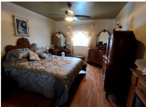
Chambre à coucher principale