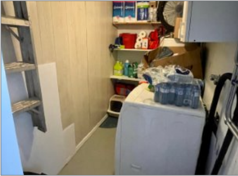
Salle de lavage

ENTRELACS, LANAUDIÈRE, J0T 2E0 | N° 23526641