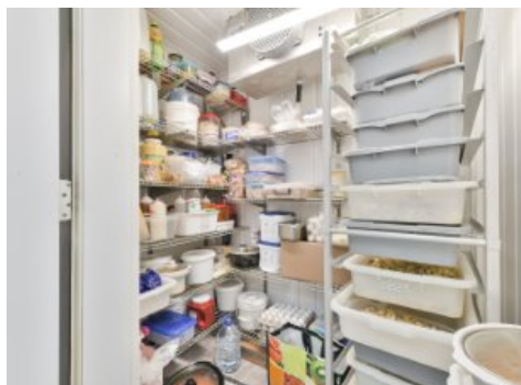
Cave/ chambre froide