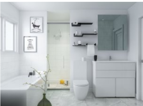
Salle de bains