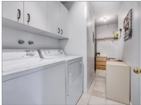
Salle de lavage