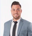
Anthony St-St Courtier Immobilier Inc.

Société par actions d'un courtier immobilier résidentiel et commercial