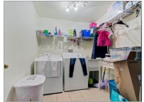
Salle de lavage