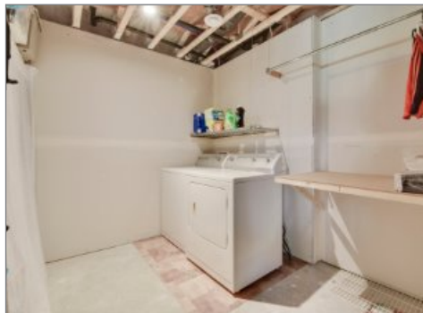
Salle de lavage