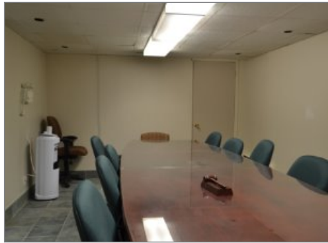
Salle de conférence