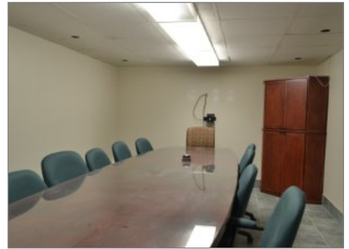
Salle de conférence