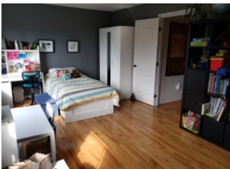
Chambre à coucher