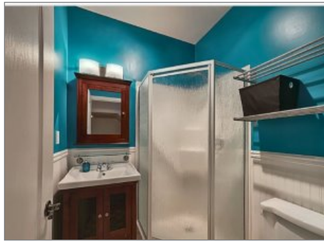
Salle de bains