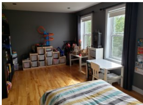
Chambre à coucher