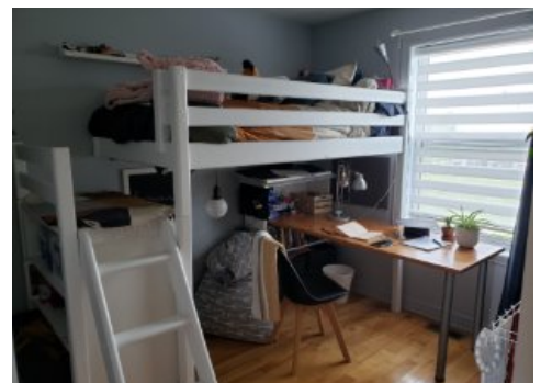
Chambre à coucher