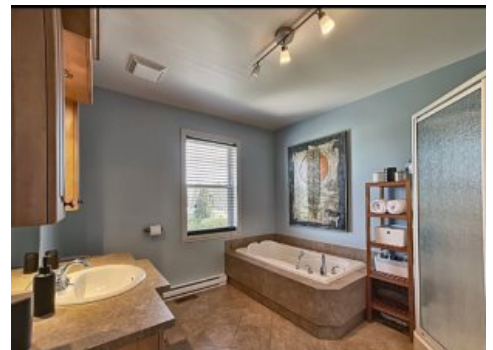
Salle de bains