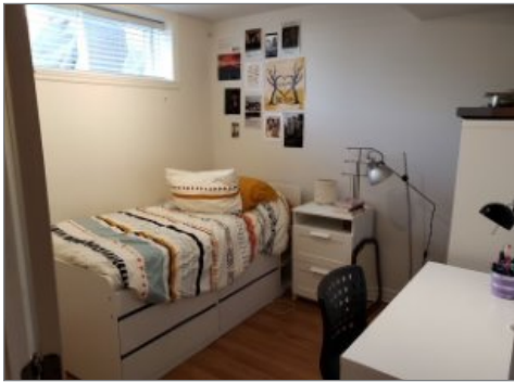
Chambre à coucher

CHAMBLY, MONTÉRÉGIE, J3L 0B5 | N° 17813653