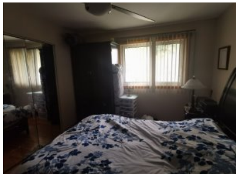
Chambre à coucher principale