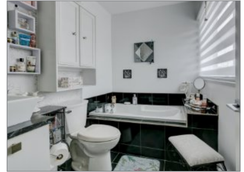
Salle de bains attenante à la CCP