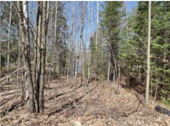
Accès au plan d'eau