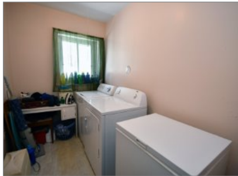
Salle de lavage