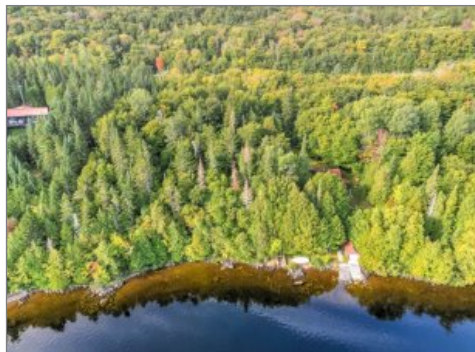
Bord de l'eau