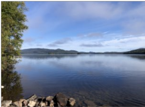
Bord de l'eau