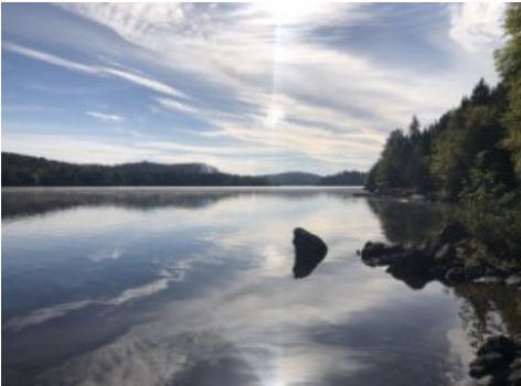
Bord de l'eau