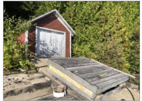
Bord de l'eau