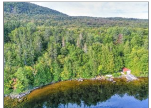
Bord de l'eau