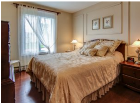
Chambre à coucher principale