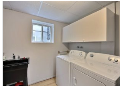
Salle de lavage