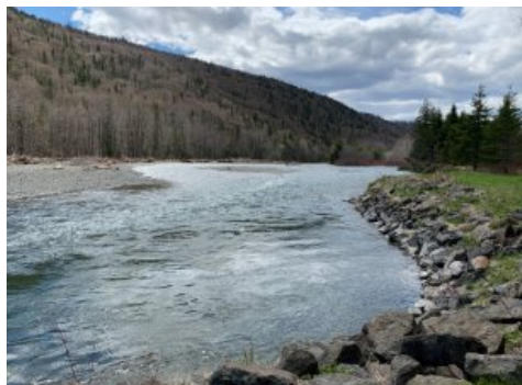
Vue sur l'eau