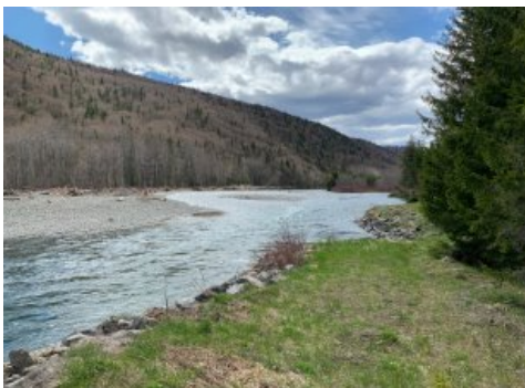
Vue sur l'eau