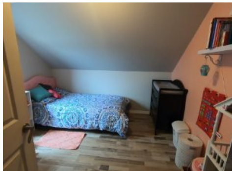
Chambre à coucher