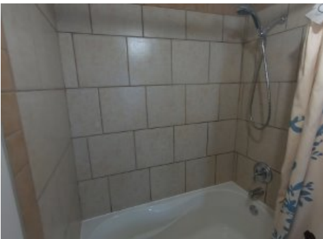
Salle de bains