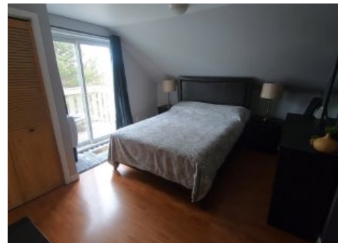
Chambre à coucher principale