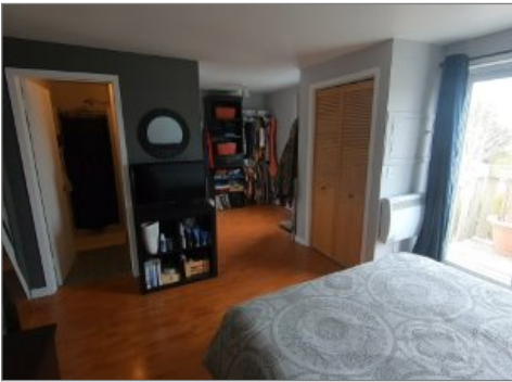
Chambre à coucher principale

MACAMIC, ABITIBI-TÉMISCAMINGUE, J0Z 2S0 | N° 10638171